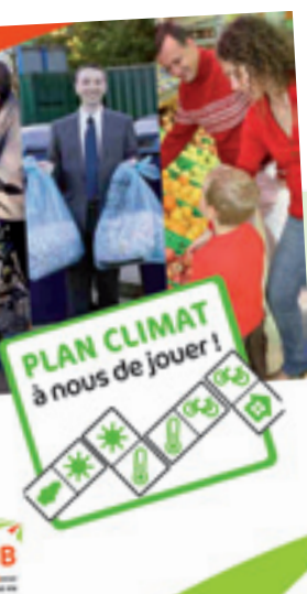
« PCET à nous de jouer ! jeu de domino Cap 3B »

Il faut maintenant aller à la rencontre des différents territoires (les élus et la population) pour expliciter les objectifs du PCET et démontrer que chaque geste du quotidien compte pour notre qualité de vie. Pour intéresser le jeune public, à quand le jeu de domino PCET ?